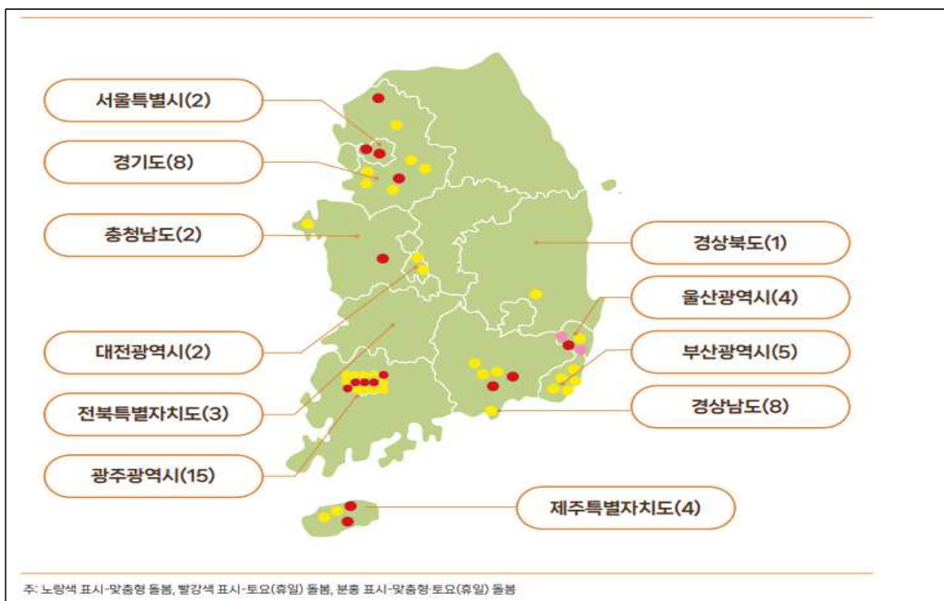
[그림 II-1] 거점형 돌봄기관 지정·운영 현황(2025년)